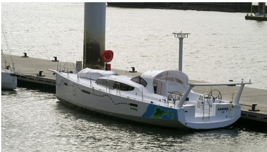
Le voilier Kahuna attendant ses voiles.

Vous recevez cet e-mail car vous vous êtes inscrits à la Newsletter de l'expédition Kahuna. Pour être certain de continuer à recevoir nos nouvelles, pensez à approuver cet expéditeur.