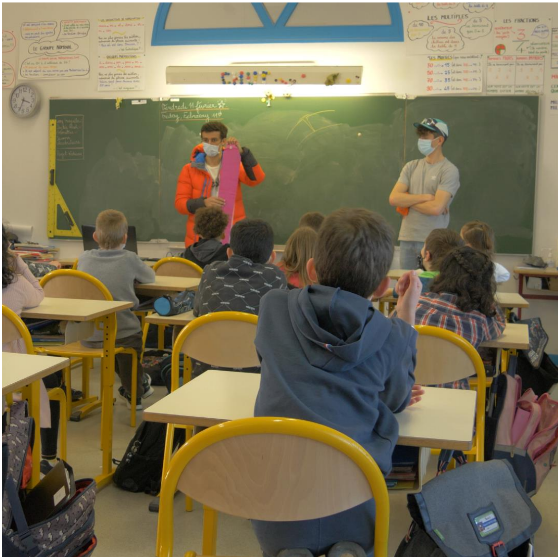
Elle est bizarre cette peau de phoque toute rose ☺

Cela tournait beaucoup autour des évènements exceptionnels, mais ils ont eu raison d'en parler car nous devons nous y préparer.