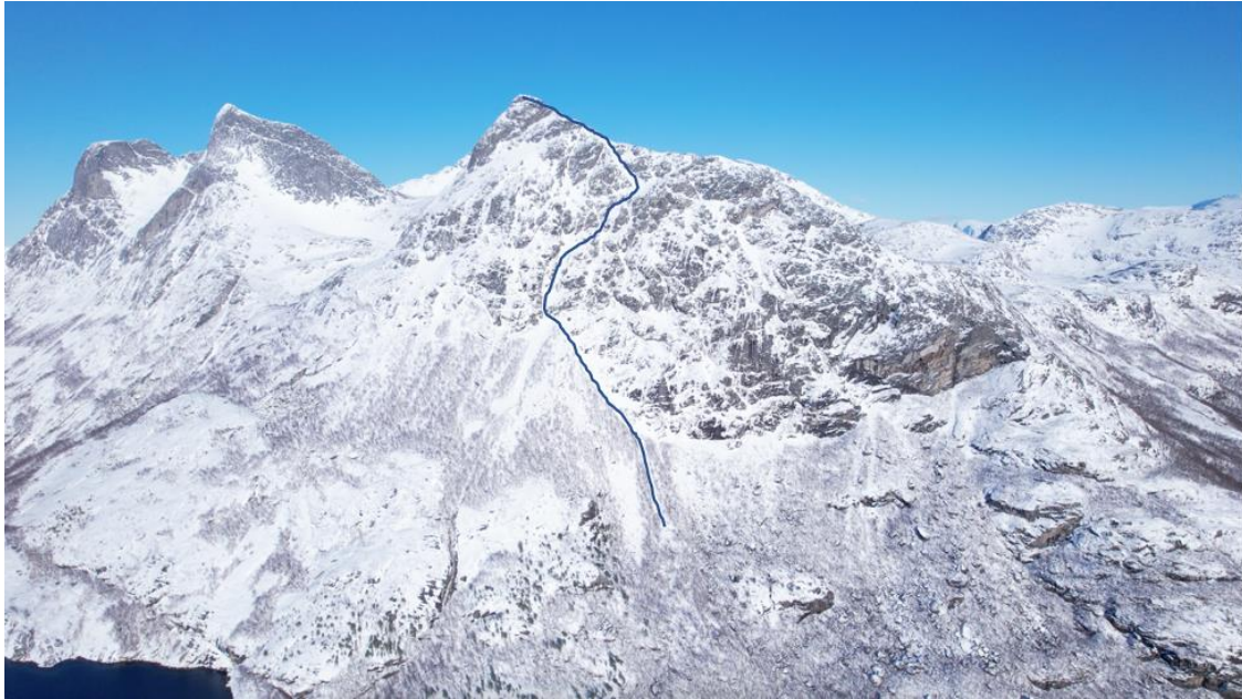
Bientôt sur CampToCamp