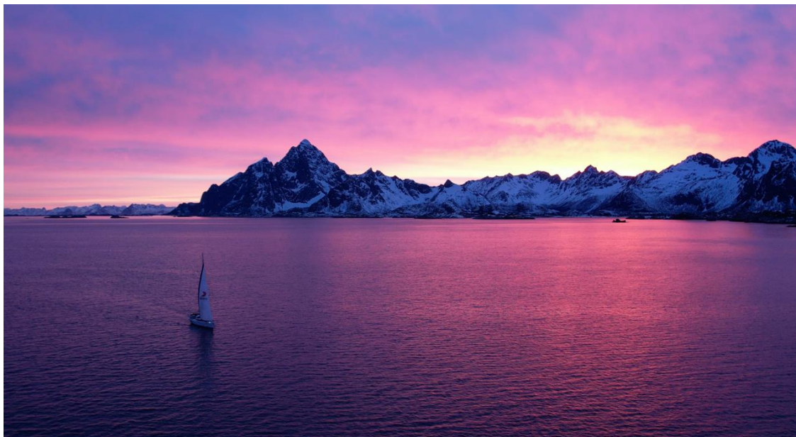
Euphorie générale à bord

L'après-midi, nous partons pour un fjord prometteur à l'est de Svolvaer. Cette fois-ci, la mer est plate, le vent est tombé, le festival de lumières peut commencer.